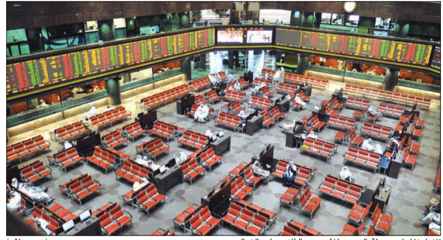
ارتفاعاً بسيولة السوق للأسبوع الثاني على التوالي